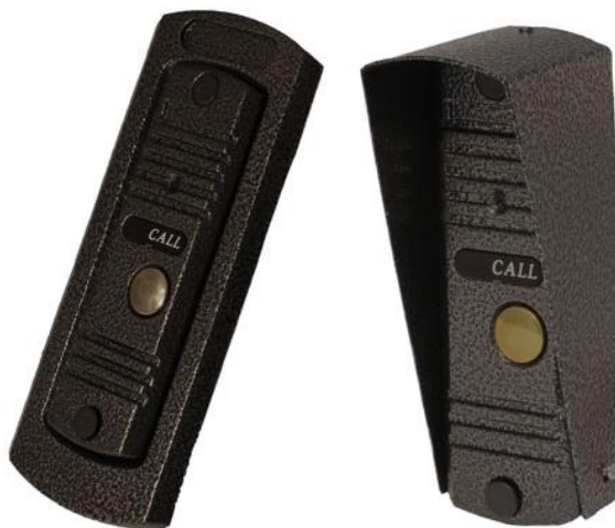
Вызывная панель для видеодомофонов HIQ-CCD9