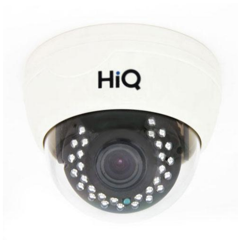
Цветная IP камера HiQ-2610