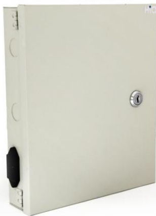
Блок питания HiQ-1209